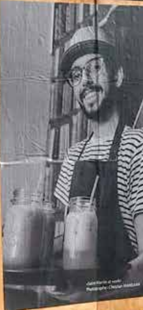
« Saint-Martin at work »