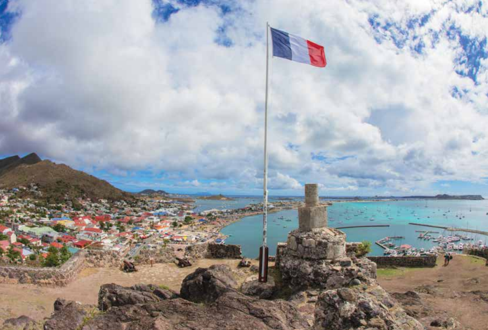
Vue de Marigot depuis le Fort Louis