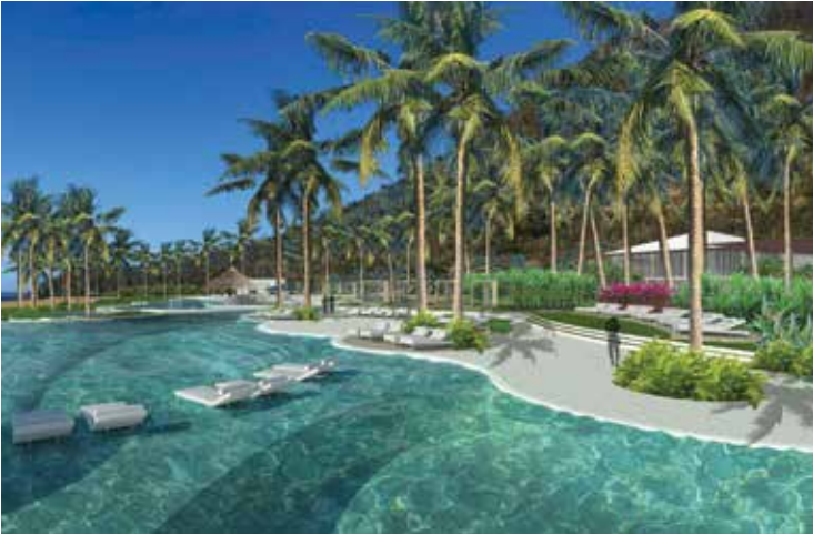
La piscine du futur Secrets Hotel (Anse Marcel)