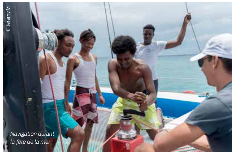
Navigation durant la fête de la mer