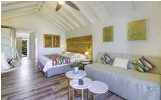
Chambre à La Playa