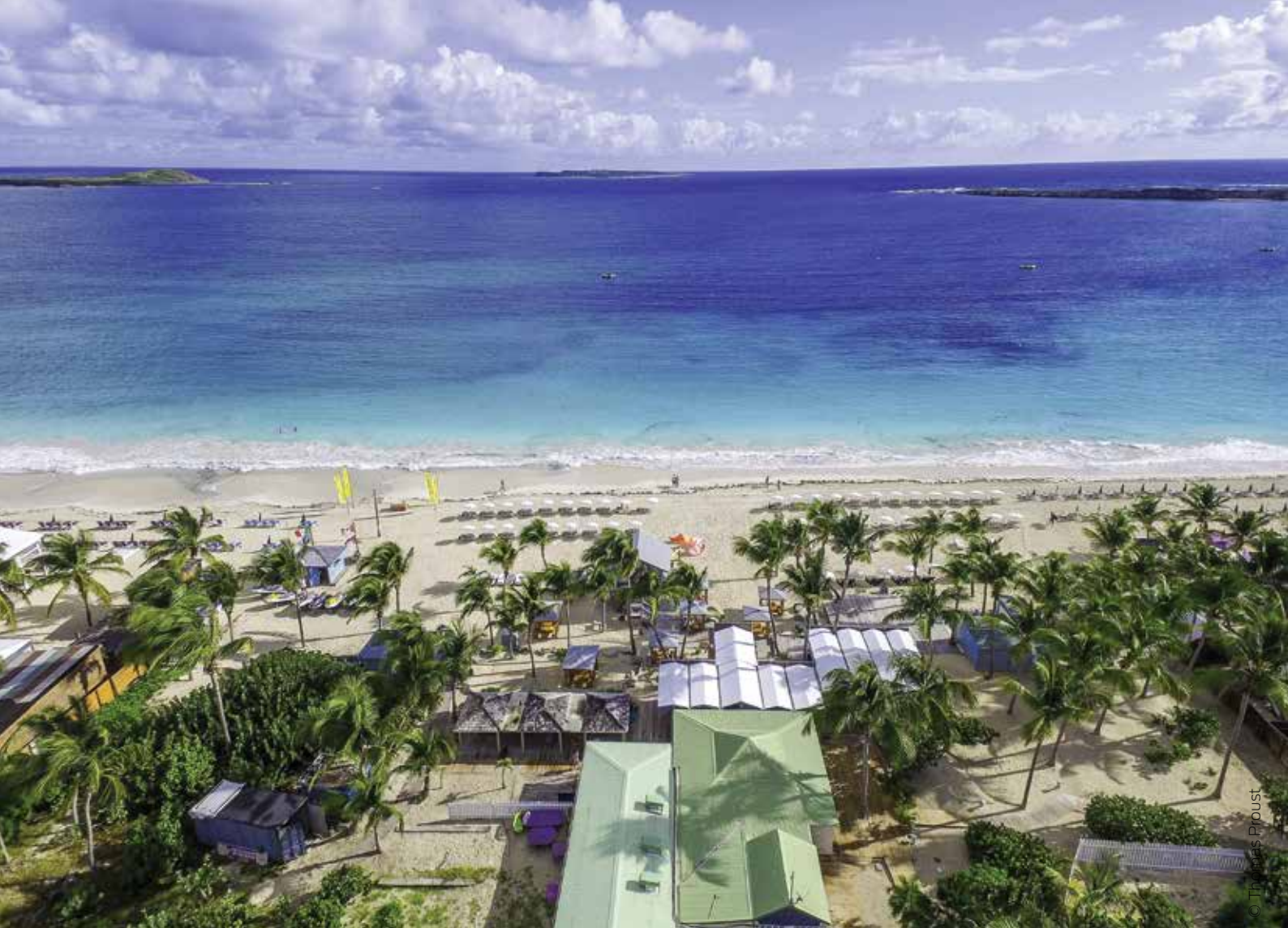
Vue du ciel de La Playa