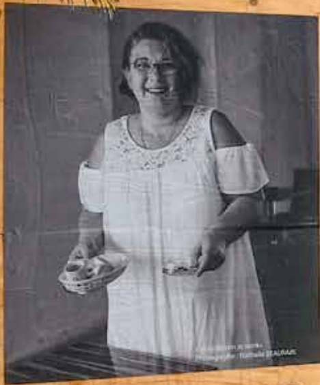
« Saint-Martin at work »