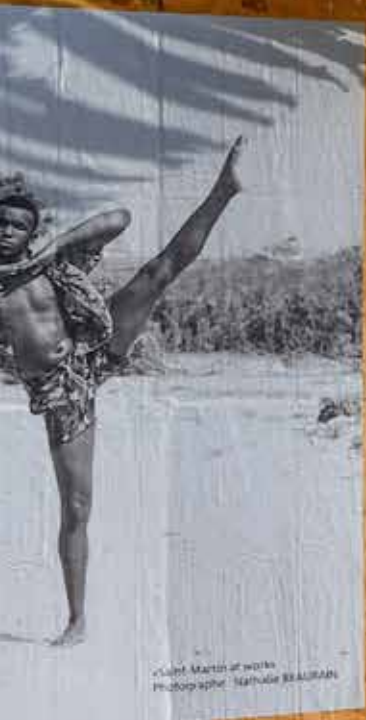
« Saint-Martin at work »