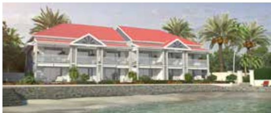
Le projet immobilier Oasis

Texte Willy Gassion