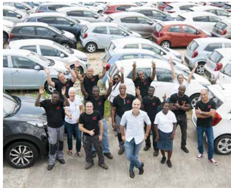
L'équipe KIA de gauche à droite et de haut en bas :

Nous assurons l'importation des voitures, la vente, le service après-vente. Nous avons beaucoup amélioré la sécurisation de nos systèmes avec la mise en place d'une solution digitale qui permet au client la traçabilité de sa commande. Nous avons aussi amélioré le processus des